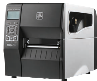
ETIKETTENDRUCK: Der ZT230 von Zebra arbeitet mit einer Druckgeschwindigkeit von bis zu 152 Millimeter pro Sekunde.

Anhand der Analyse erfolgte dann eine von PFB zielgerichtete Beratung hinsichtlich der Anschaffung eines Dokumentenscanners und eines Etikettendruckers. „In Sachen Etikettendrucker wurde bald deutlich, dass für diese Aufgabenstellung ein sehr schnelles und höchst performantes Gerät mit langer Lebensdauer und geringem Wartungsaufwand benötigt war“, berichtet Gugler. „PFB hat aus diesem Grund den ZT230 von Zebra empfohlen,